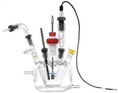
Şekil 3.1 Elektrodepolama Hücresi

Tüm şekil resim, tablo ve çizelgeler ilgili bölümün ana başlığına göre sıralanarak her biri aşağıda belirtildiği gibi kendine ait numarası ile numaralandırılmalı ve koyu renkle yazılmalıdır.